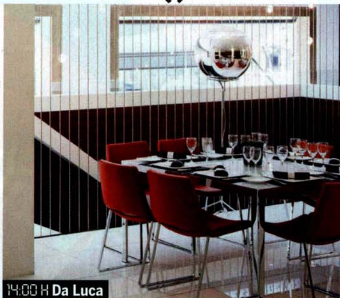
14:00 H Da Luca

◀ Cuchilleros, 3, Madrid, tel. 913 66 97 71, kitchenstories.es . Precio medio desayuno: 4 €; comida, 25 €.