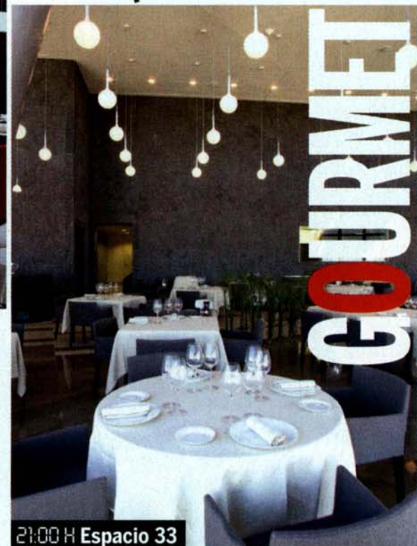
21:00 H Espacio 33

◀ Mallorca, 251, Barcelona, tel. 934 67 77 55, www.restaurantelaluca.com . Precio medio: 20 €.